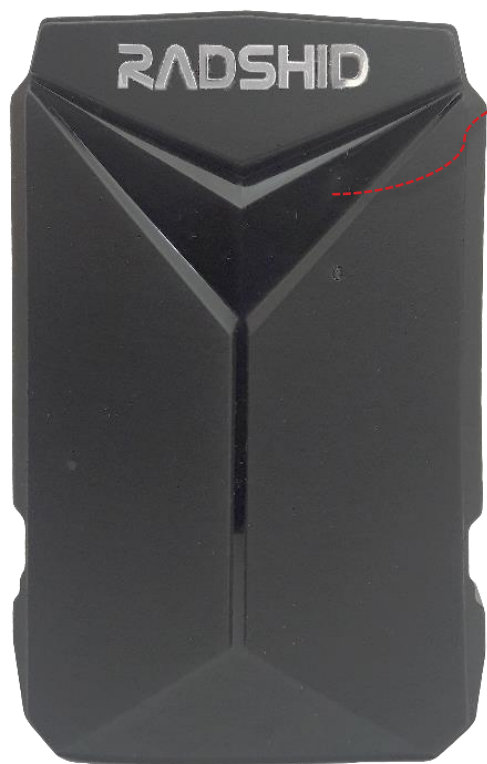
چراغ های وضعیت ردیاب